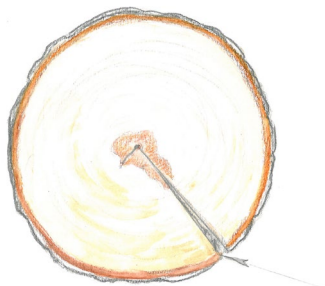
Žūšanas plaisa skar mizu – finierklucis tiek brāķēts.

Apalkoksnēs kvalitāte var pasliktināties arī uzglabāšanas laikā. Žūšanas plaisas, marmora trupe, zilējums un kukaiņu ejas var būt par iemeslu, kādēļ augstvērtīgi sortimenti tiek brāķēti un elites klases finierkluči jāpārdod par papīrmalkas vai malkas cenu, bet A klases zāģbaļķi – par guļšņu koksnes cenu. Pavasarī, sulu laikā, un vasarā cirsta koksne savu kvalitāti var zaudēt dažu nedēļu laikā.