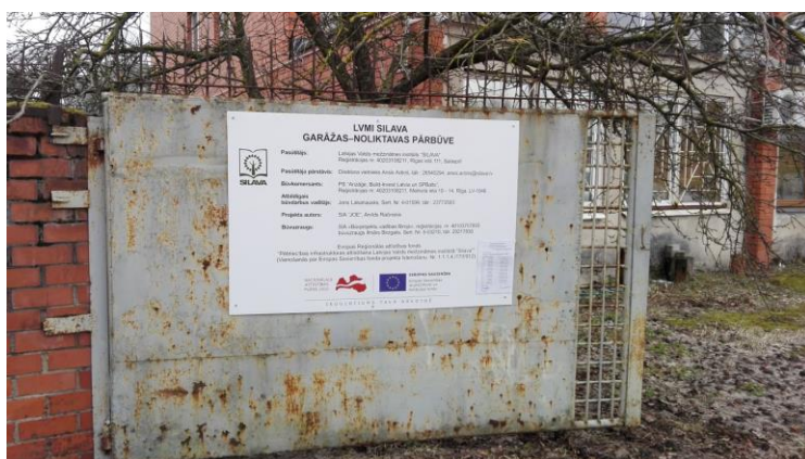
LVMI Silava garāžas – noliktavas pārbūve