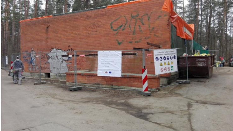
Būvdarbi pētnieciskās infrastruktūras izveidei Institūta ielā 6/1