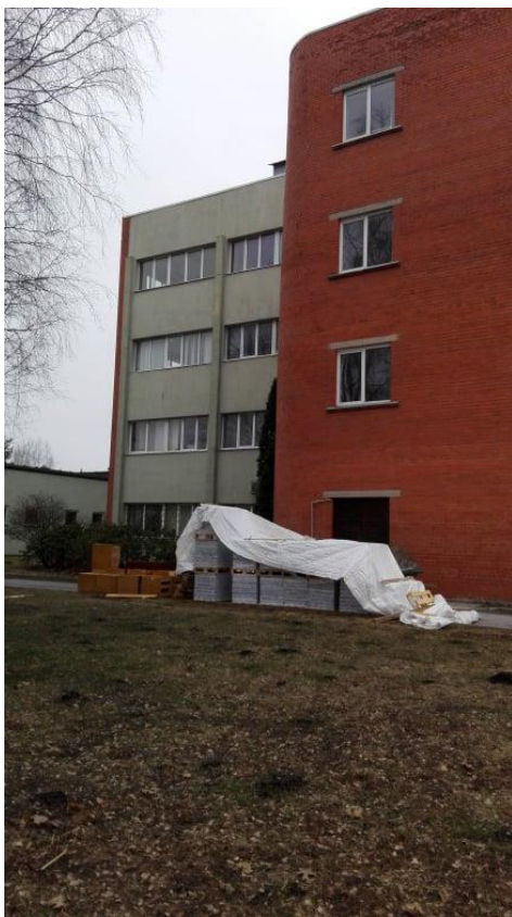
Būvdarbi LVMI "Silava" centrālajā ēkā

Pētniecības infrastruktūras projekta ietvaros paredzēta arī pētniecības aprīkojuma - zinātniskās aparatūras, aprīkojuma un instrumentu komplektu iegāde.