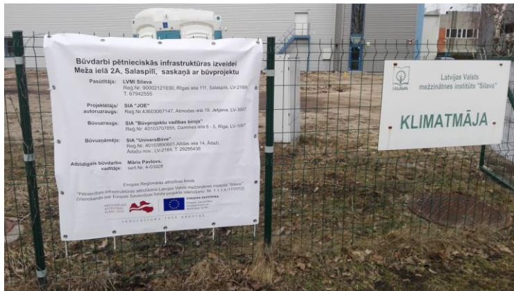
Būvdarbi pie Klimatmājas laboratoriju kompleksa izbūvei

LVMI Silava izsludinātais iepirkumu konkurss “Būvdarbu veikšana LVMI Silava” (identifikācijas Nr. LVMI Silava/2018/4/AK/ERAF) noslēdzās 4. decembrī un šobrīd ir uzsākti būvdarbi gan LVMI “Silava” centrālajā ēkā, kur paredzēta ēkas renovācija; gan garāžu un noliktavu telpās, kur paredzēta telpu rekonstrukcija; gan arī būvdarbi pie Klimatmājas, kur paredzēta laboratoriju kompleksa ar klimata regulēšanas iespējām izbūve un ierīkošana.