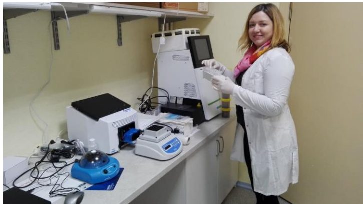
Nukleīnskābju fragmentēšanas iekārta darbībā

Piegādātā aparātūra jau tiek izmantota pētniecības darbā, piemēram: dzīvsudraba analizators cietiem un šķidriem paraugiem, digitālais penetrologers, sekvenēšanas (NGS) sistēma, digitālā PCR iekārta, kā arī laminārie boksi, nukleīnskābju fragmentu selektors, oglekļa, ūdeņraža, slāpekļa, sēra, skābekļa un hlora elementanalizators u.c.