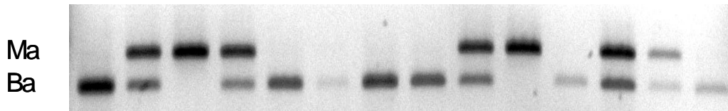
1. attēls. 16. marķiera, ar restrikcijas fermentu šķeltie fragmenti.

1. attēlā attēlots 16. marķiera ar restrikcijas fermentu šķeltie fragmenti. Augšējais fragments raksturo melnalksni, zemākais baltalksni, hibrīdos atrodas abi. 2. attēlā attēloti 10. marķiera, specifiskie PCR amplifikācijas produkti. Kopumā attēloti rezultāti no 6 indivīdiem (1-6). Fragments pirmajā joslā raksturo melnalksni, otrajā - baltalksni, hibrīdos atrodas abi fragmenti.