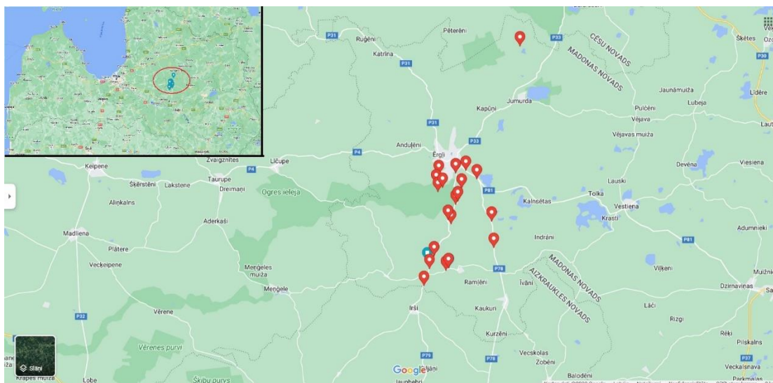
1. attēls. Daudzgadīgo zālaugu ĢR paraugu ievākšanas vietas 2022.gada ekspedīcijā

2022.gadā organizētajā zālaugu ģenētisko resursu ekspedīcijā piedalījās LBTU Zemkopības institūta speciālisti. Tika ievākti 52 paraugi (LBTU ZZI), (pārsvārā sēklas, bet tika izrakti un pārvietoti arī atsevišķi augi ar visām saknēm): 15 tauriņziežu paraugi (dažādu sugu āboliņi, amoliņš, u.c.); 37 stiebrzāļu paraugi (dažādu sugu auzenes, skarenes, timotiņi, kamolzāle, lapsaste, smilga, trīsulis)