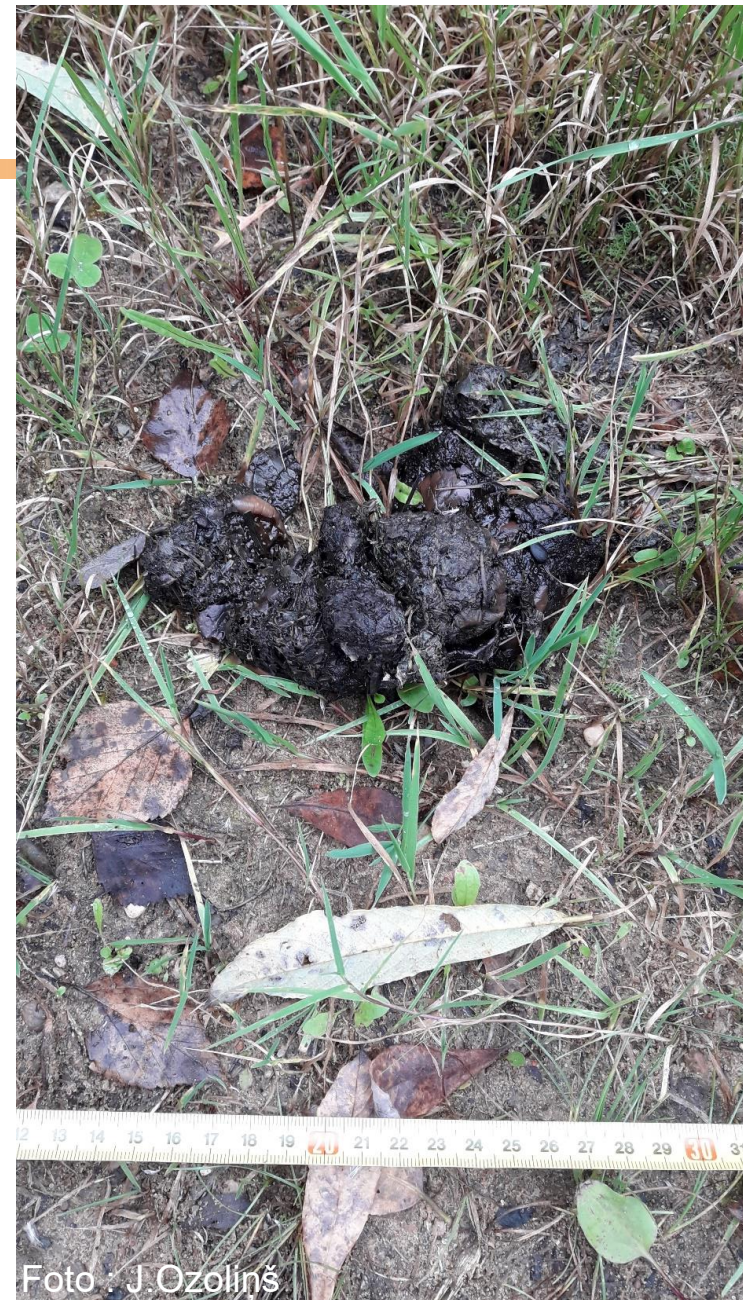
Lāča ekskrements fiksēts veicot fona monitoringu